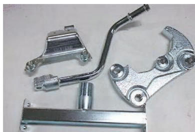
【亜鉛めっき+3価クロム白色被膜】