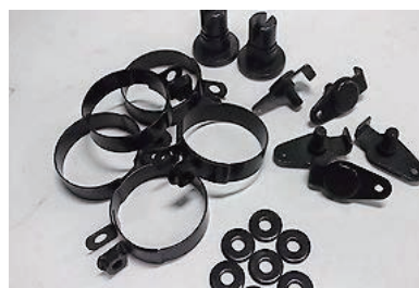
【亜鉛めっき+3価クロム黒色被膜】