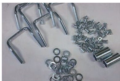
【亜鉛めっき+3価クロム白色被膜】