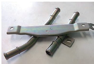
【亜鉛ニッケル合金めっき+3価クロム淡黄色皮膜】