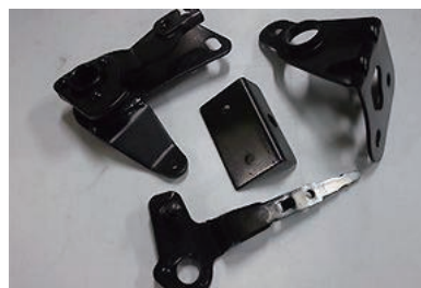
【亜鉛めっき+3価クロム黒色被膜】